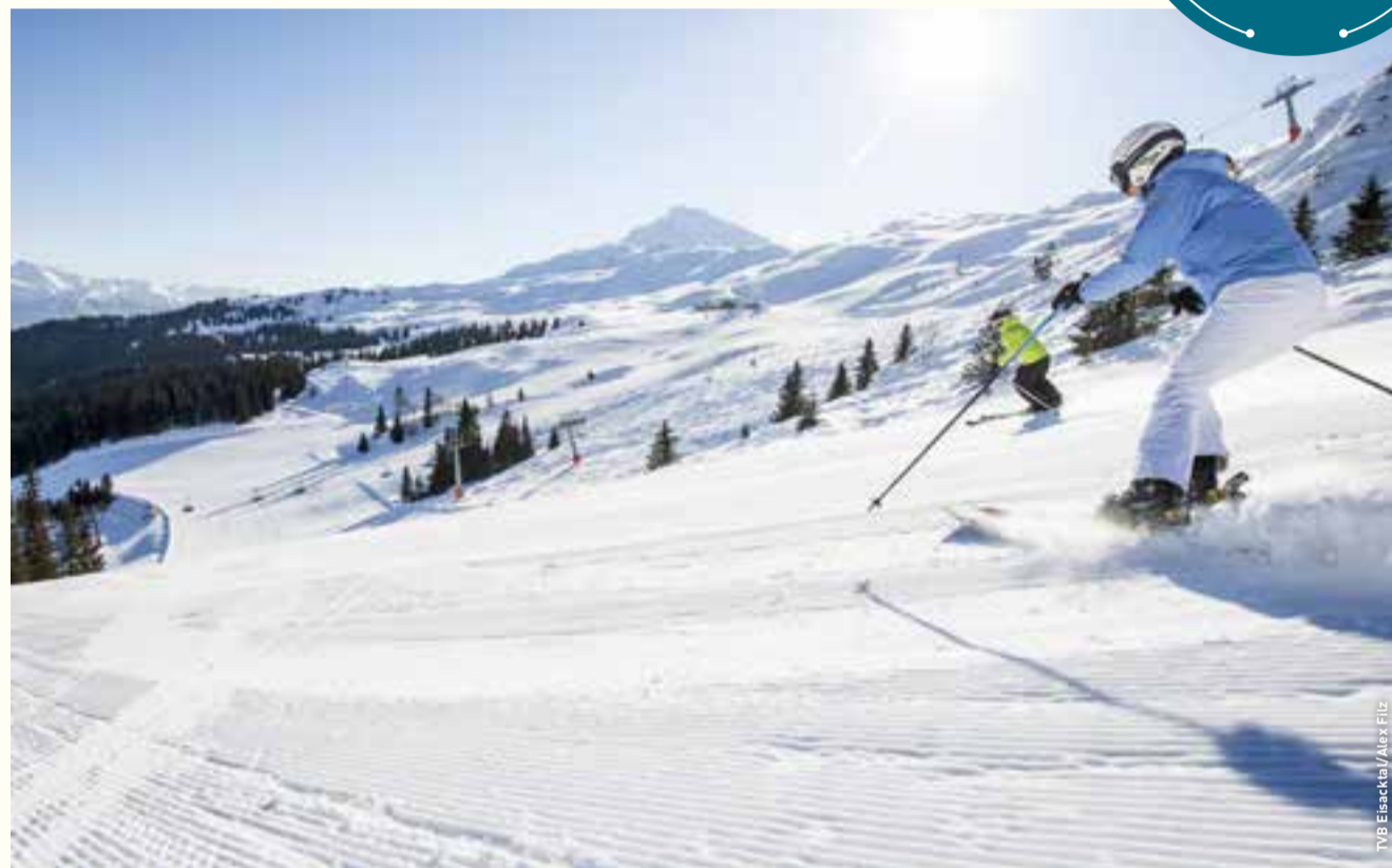
TVB Eisacktal/Alex Filz

UNSER TIPP Südtiroler Christkindlmärkte: Advent/Weihnachten/Silvester