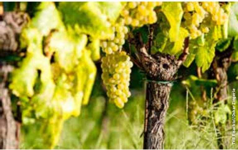
TVB Eisacktal / Oskar Zingerle